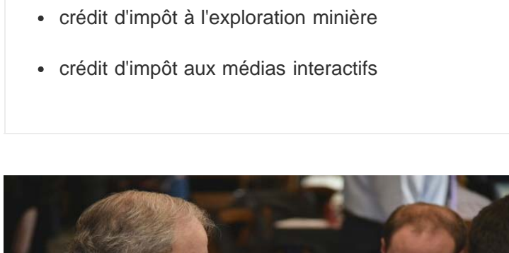
Le commentateur politique Michel Lagacé